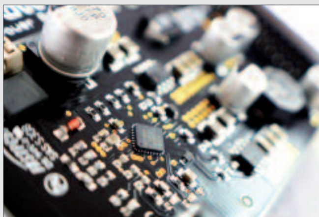
Das Embedded Platform Concept (EPC) von Arrow erlaubt es, den Entwicklungsaufwand deutlich zu reduzieren und die Markteinführung zu beschleunigen.

RS232 und einen SD-Card Einschub. Über Erweiterungsmodule können zusätzlich beliebige weitere Ports hinzugefügt werden. Für die Zählerabfrage wurde beispielsweise bereits ein Wireless M-Bus (wM-Bus) Extension Board entwickelt, und die